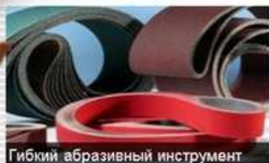
Гибкий абразивный инструмент