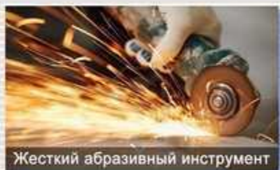
Жесткий абразивный инструмент